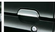
メッキドアハンドルガーニッシュ