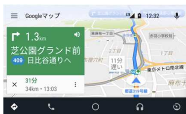
ナビゲーション (Googleマップ™)