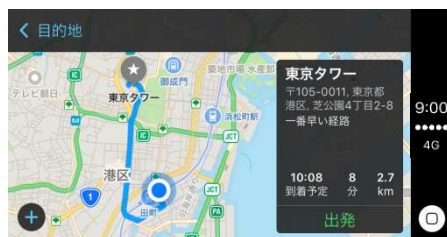
ナビゲーション (マップ)