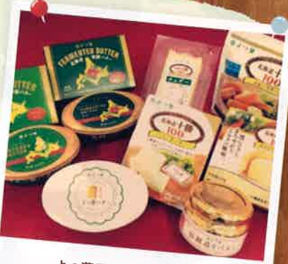
よつ葉乳業 乳製品各種