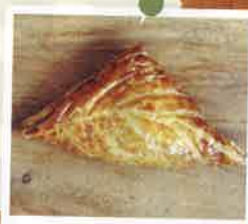
安納芋デニッシュ