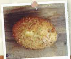
十勝若牛カレーパン