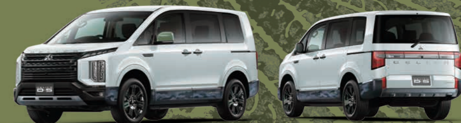
PHOTO: CHAMONIX コンプリートパッケージ 電動サイドステップ装着車 ボディカラー: ホワイトダイヤモンド/ブラックマイカ(有料色:77,000円高/消費税抜価格:70,000円高)