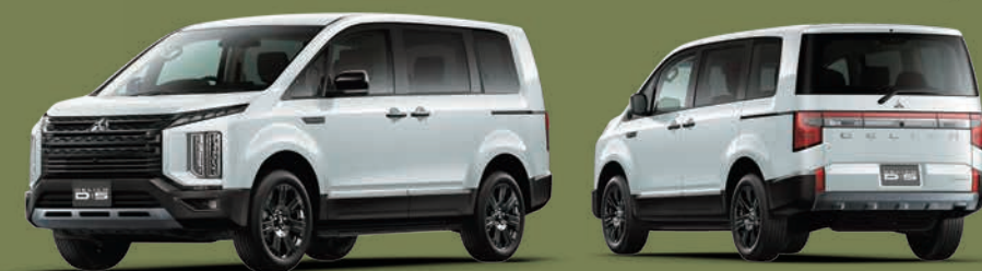
PHOTO: CHAMONIX 電動サイドステップ装着車 ボディカラー: ホワイトダイヤモンド/ブラックマイカ(有料色: 77,000円高/消費税抜価格: 70,000円高)

(消費税抜価格 4,143,000円) ●リサイクル料金14,040円が別途必要となります*。