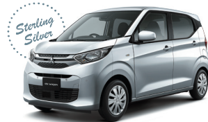
■スターリングシルバーメタリック(KM)[U25]