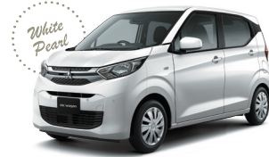
■ホワイトパール(有料色)*3(SL)[W13]