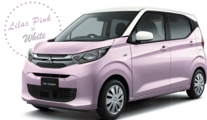
■ライラックピンクメタリック / ホワイトソリッド (有料色)*1(FE)[P67/W37]