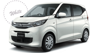
■ホワイトソリッド(3E)[W37]