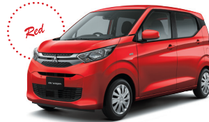
■レッドメタリック(RR)[P26]