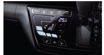
タッチパネル式フルオートエアコン