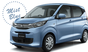
■ミストブルーパール(有料色)*3(MP)[D32]