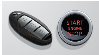
キーレスオペレーションシステム&エンジンスイッチ