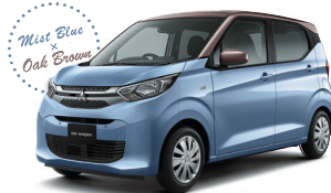
■ミストブルーパール / オークブラウンメタリック (有料色)*2(FD)[D32/C22]