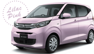
■ライラックピンクメタリック(LA)[P67]