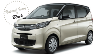
■ナチュラルアイボリーメタリック / ブラックマイカ (有料色)*2(UW)[S45/X42]