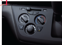
マニュアルエアコン