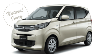
■ナチュラルアイボリーメタリック(有料色)*3(TP)[S45]