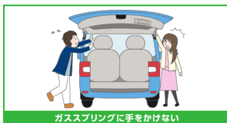
ガススプリングに手をかけない

テールゲートの取っ手に手をかけたままテールゲートを閉じないでください。手や腕をはさみ、けがをするおそれがあります。テールゲートを途中まで引き下げたら、手をはなしてテールゲートを軽く押しつけてください。