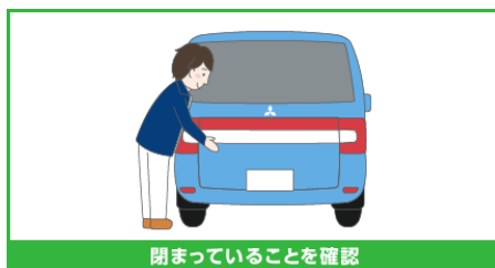
閉まっていることを確認

ガススプリングに手をかけてテールゲートを閉めたり、押ししたり、ぶら下がったりしないでください。手をはさんだり、ガススプリングの支点がはずれ、思わぬ事故につながるおそれがあります。また、ひもを巻きつけたり、ものをかけたりもしないでください。ガススプリングが作動不良になるおそれがあります。