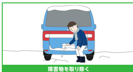
障害物を取り除く