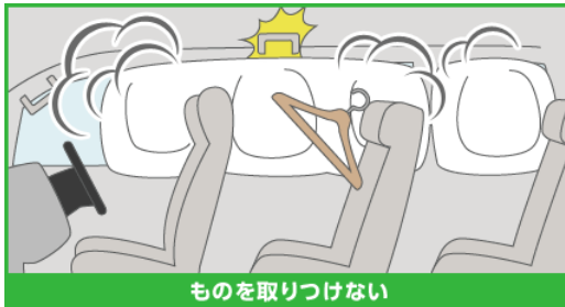
ものを取りつけない