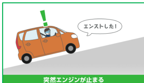
突然エンジンが止まる