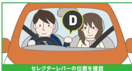
セレクターレバーの位置を確認