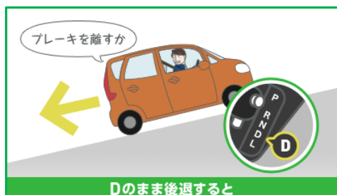
Dのまま後退すると

上り坂で、前進の位置（「D」、「Ds」など）にしたままブレーキを離して後退したり、下り坂で、後退の位置「R」にしたままブレーキを離して前進しないでください。突然エンジンが止まってしまうことがあります。エンストすると、ブレーキの効きが非常に悪くなったり、ハンドルが非常に重くなり、思わぬ事故につながるおそれがあります。